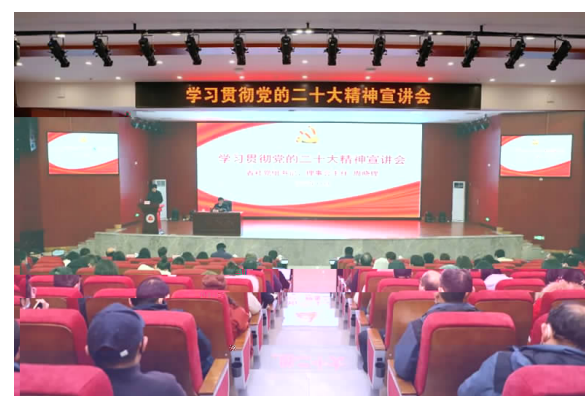
11月30日 省 讲 精神 晓 来 湖南 精

神走 层、 晓 焦 精神 什么 怎么 四 享 习 报 扣 什么 晓 指 迈 程、 百年 标 军 键 指 贯彻 精神 需 盼 省 站、 扣 内容、 焦 键 点、 悟 点 握 九 焦 越 怎么 怎么 晓 指引 贯通 题 所、 所悟、 所、 所用